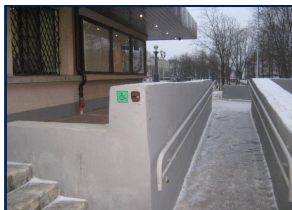
ОАУК «Новгородский областной киноцентр»