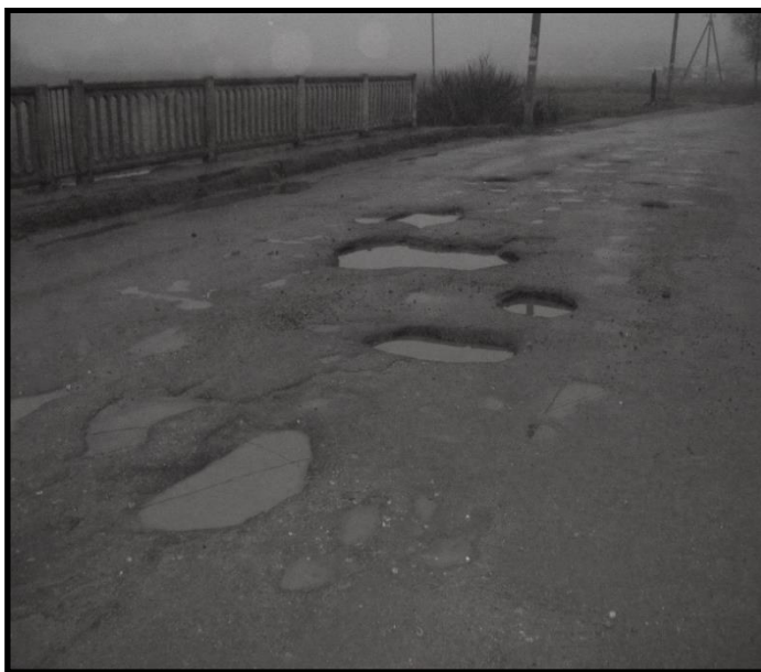
Асфальтовое покрытие моста через р. Соковая - единственного проезда к муниципальному кладбищу «Западное», 2014 год

поселения. И это только начало процесса, итогом которого должно стать создание безопасных условий передвижения транспорта и людей к важному городскому объекту. Таким образом, глубоко и всесторонне изучив проблему, Уполномоченный будет контролировать её решение.